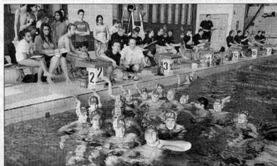
Les lycéens de Libergier en force.

400 millions d'enfants n'ont pas accès à l'eau potable dans le monde ; 2, 6 milliards de personnes vivent sans installations sanitaires adéquates, 4.200 enfants meurent chaque jour de maladies diarrhéiques. Hier, les 12 heures ont aussi été placées sous le signe de l'eau avec un stand et des tronc pour l'Unicef et sa section locale présidée par Simone Maimay, qui se bat pour